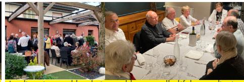
Les discussions vont bon train avant le repas collectif du samedi soir...