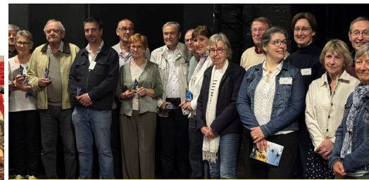
Les lauréats et quelques membres du jury après la remise des prix...