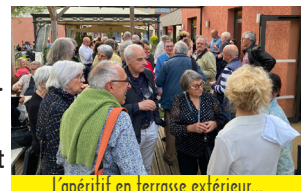
L'apéritif en terrasse extérieur...

* Films sélectionnés pour les Rencontres Nationales de Soulac-sur-Mer.