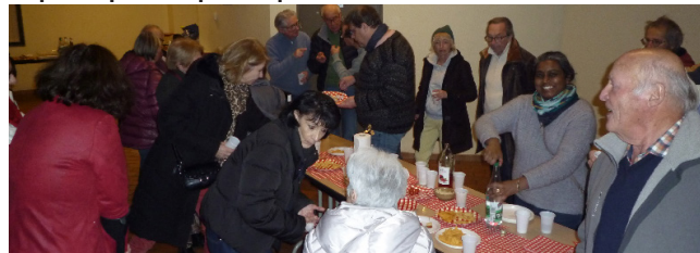
Après l'apéritif offert par le CCA, les adhérents et leurs proches toujours bienvenus, ont partagé le repas canadien...