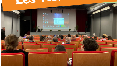
Dès vendredi soir, la salle se remplit tranquillement...